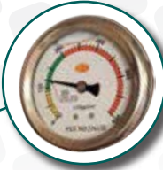
manometro idraulico controllo tensione lama