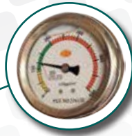
manometro idraulico controllo tensione lama