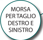
MORSA PER TAGLIO DESTRO E SINISTRO