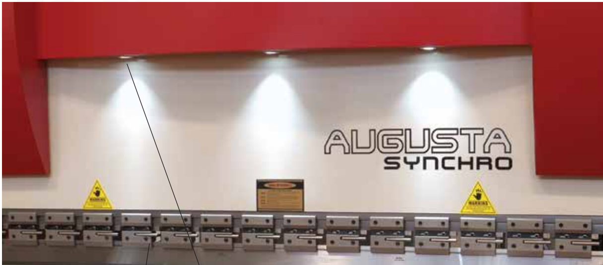
Cambio utensile rapido