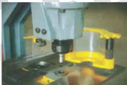
Stazione di punzonatura