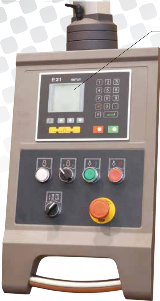
Posizionatore a 2 Assi