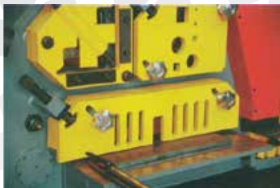
Cesoia e taglia profili