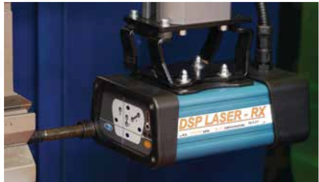
Impianto laser di sicurezza