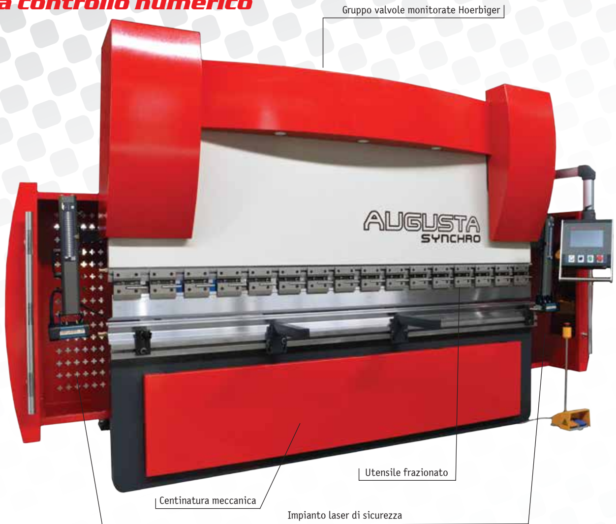
CNC ESA S630

Meccanica conforme alle nuove normative per la sicurezza CE e conforme all'allegato IV